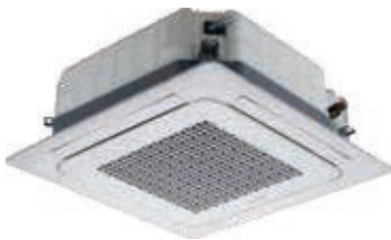
Wind-Free™ Mini 4-Wege-Kassette (für den Einbau in die Zwischendecke)