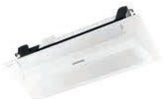
Wind-Free™ 1-Wege-Kassette (für den Einbau in die Zwischendecke)