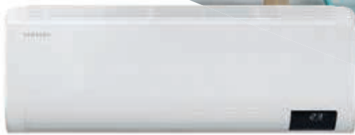
Wind-Free™ Wandgerät (für die Montage an die Wand)